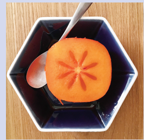
断面が*可愛い♪何と言っても手があまり汚れないし、まな板いらないのが最高です。

ラザロの女子スタッフが「買ってよかったもの」「美味しかったもの」「楽しかったこと」など「ちよつと嬉しくなった」アイテムやできごとをこっそりお届けします。女性を悦ばせたい男性必見!