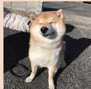
▲「ひなたぼっこが好きな、柴犬のリキ」 カツベ歯科クリニック 勝部義明先生