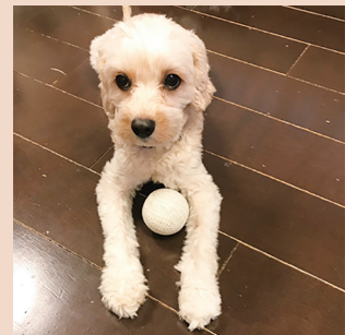
▲「ボール遊びが大好きなキャバリアプードルのクイール。」 なかやま歯科 中山隆司先生