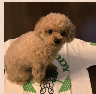
▲「トイプードルの『くう』(♀)3歳は、私が家に帰ると異常な位はしゃぎ、顔を舐め回してきます。こんなにも私の事を『損得抜き』で愛してくれるのは彼女だけです。あれ…なんでだろう、…なんで涙が。。。」 株式会社 LAZARUS 村田彰弘