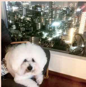
▲「夜景をバックに酒の相手をしてくれるピションフリーゼのシュウ」 久保デンタルクリニック 久保達也先生