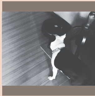
▲「ルンバと闘うポストンテリアのボタンくん!!」 神戸小林歯科 中川敬史先生