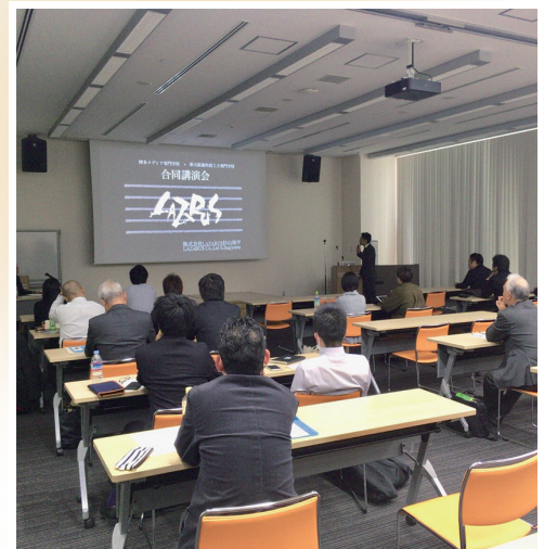
「新大阪と福岡の歯科技工士専門学校の合同同窓会にて講演をさせていただきました。外部からの依頼をいただくことも多いです。」

バリエーション多くて、同じものが出てこないけど…最近だと鶏むね肉のチャーシューとか。全部美味しい。自分もそうだし、実家でも高たんぱく低脂肪なメニューが多いです。