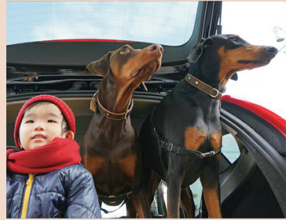
▲ドーベルマンのルイ(茶色♂)とスカル(黒色♀)。2頭は息子のボディガード！帰りの遅い技工士のお父さんに代わっていつも家族を守ってくれています(笑) アールワン 大成洋平様

先月号で募集しました、みなさまのおうちの ペット自慢♪ ふわふわ♡もふもふ♡たまに筋肉♡ あふれて止まない魅力をご紹介します！