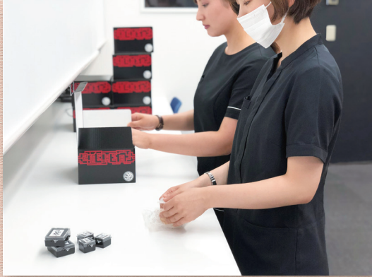
ラザロオリジナルの梱包箱もこだわりの一つ。ラポ内は常に整理整頓し、清潔に保つよう努めております。

ラザロのこだわり、それは技工だけではございません！大切なものを、大切にお届けするために。事務員の職人魂についても、ぜひお見知りおきを！！