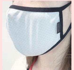
▲ヘパスキン4Dストレッチクールマスク ホワイト / ¥3,200 (税別) 株式会社シンピシン

とにかく、付け心地がいいところがオススメできます。不織布マスク単体では肌に負担を感じていたのですが、こちらの上から重ねると楽になりました◎